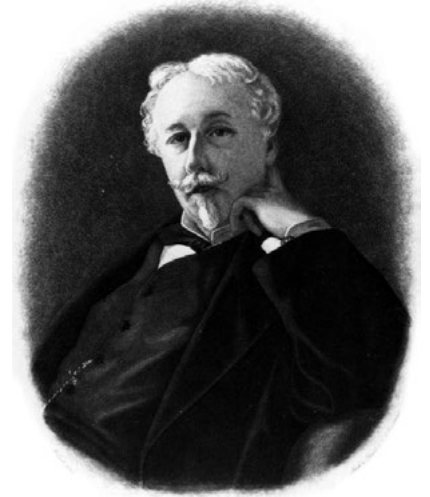
Arthur de Gobineau

Im 19. Jahrhundert wurden die Differenzen zwischen den „schwarzen“ Bewohner*innen der Kolonien und den „Weißen“ im Mutterland immer mehr mit naturwissenschaftlichen biologisch-evolutionären „Erklärungen“ (Darwin, Haeckel) begründet. Der erste, der diese „modernen Rassentheorien“ aufstellte, war der französische Diplomat und Schriftsteller Arthur de Gobineau. In seiner vierbändigen Buchreihe „Essai sur l'inégalité des races humaines“ (Entwurf über die Ungleichheit der Menschenrassen), die zwischen 1853 und 1855 erschien, bündelte er vorhandene Rassenkonzepte zu einer neuen Theorie. Er sprach als erster von der „arischen Menschenrasse“, rechnete aber auch die Juden dazu. Dass es „niedere und schwächere Rassen“ gab, erklärte er mit der Degeneration der „reinen weißen Rasse“, weil sie sich Jahrhunderte lang mit anderen gemischt habe.