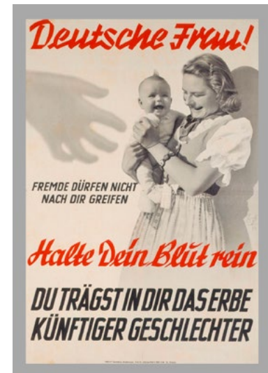
Plakat der NSDAP Gauleitung Sudetenland, Amt für Volkswohlfahrt 1944

Am 15. September 1935 wurden von der Hitler-Regierung antisemitische Rassengesetze erlassen. Mit einer undurchsichtigen Klassifizierung (unabhängig davon, ob die Betroffenen sich selbst als Jüdinnen und Juden verstanden oder einer jüdischen Gemeinde angehörten) wurden Menschen jüdischer Abstammung – je nach der Anzahl ihrer „volljüdischen“ Großeltern – in „Volljuden, Dreiviertel-, Halb-, oder Vierteljuden“ unterteilt sowie in „Mischlinge 1. und 2. Grades“. Das Gesetz legitimierte die Verfolgung der gesamten jüdischen Bevölkerung im Nationalsozialismus und endete in der Ermordung von rund sechs Millionen Jüdinnen und Juden.