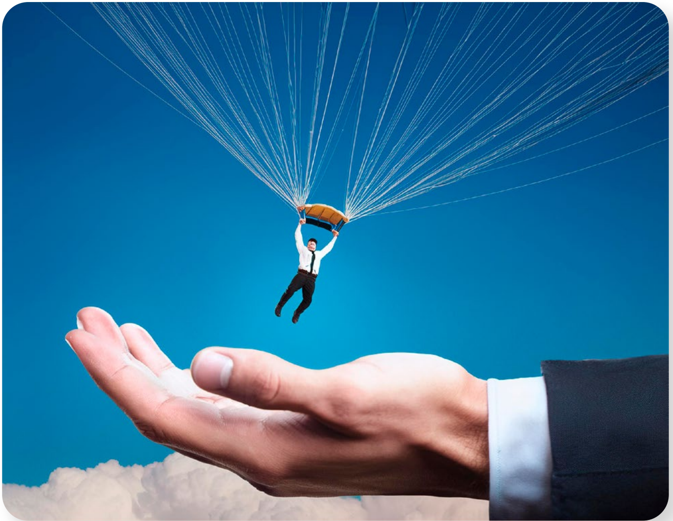
Abb. 2: Prompt: „Ein Mensch in einem Fallschirm landet in einer großen Hand.“