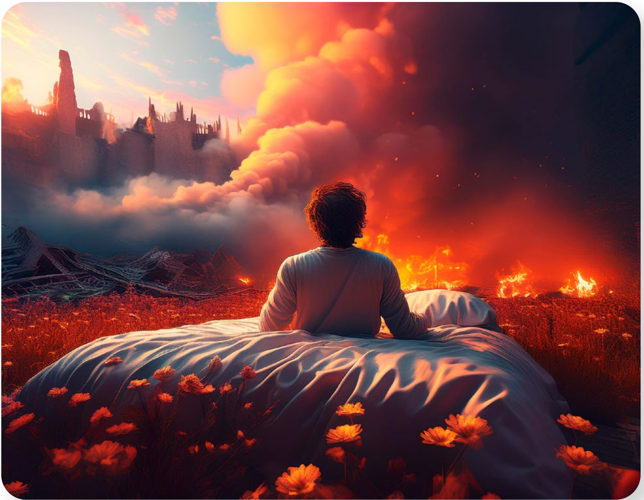
Abb. 3: Prompt: „Ein Mensch im Bett in einer Ruinenlandschaft. Feuer und Rauch. In einer Gedankenblase Blumen.“