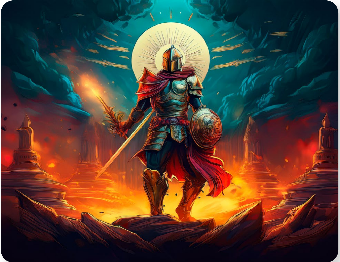
Abb. 1: Prompt: „Bild mit dem Titel: Die Stärke ist die Hand Gottes auf der Schulter des Mutes“